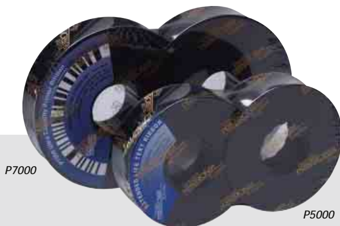
Neues Konzept und Spule mit höherer Kapazität bieten Höchstleistungen bei niedrigen Betriebskosten