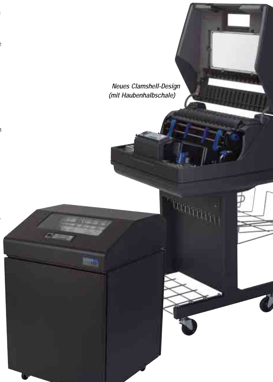
Neues geschlossenes Gehäusedesign