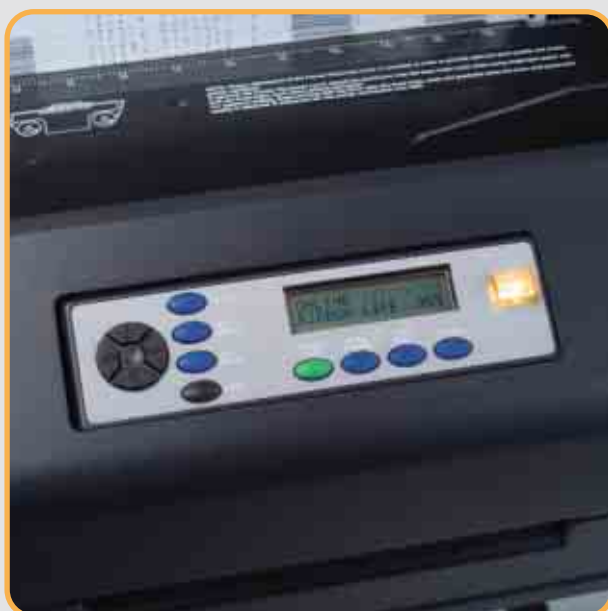
Druckaufträge können dank Angabe der Farbbandnutzungsdauer auf dem Bedienfeld genau geplant werden