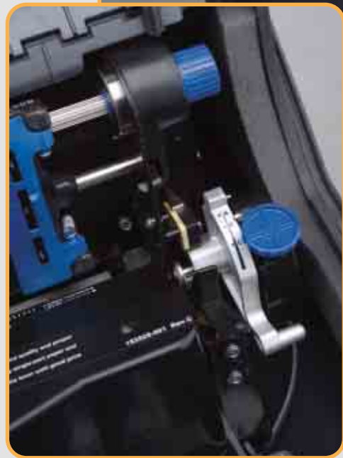
Neue Funktion zur Druckwalzeneinstellung