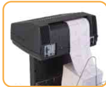
Papierzufuhr – hinten