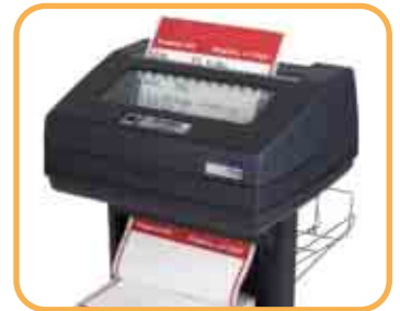
Papierzufuhr – oben